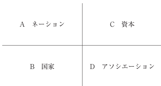
図2 資本制社会構成体の構図

柄谷はまず、「互酬」、「再分配」、「商品交換」、という三つの交換様式を列挙した後に、唐突にもう一つの交換様式を挙げる。