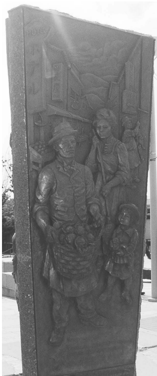
図1 日本町ランドマーク「一世」パネル 2008年3月

1. 一時的な滞在者にすぎない者も 明確な展望を持つ者も大地に手を ひろげ 未来への希望を収穫する このアメリカで 19)