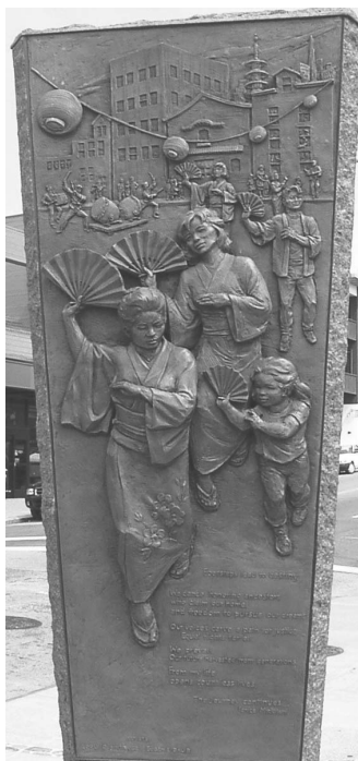
図3 日本町ランドマーク「文化」パネル 2008年3月

当時幼かったミリキタニ自身もアーカンソー州のローワーに収容された 20) 。一世がかつてアメリカに寄せた未来への希望は、戦時の強制収容体験によって引き裂かれた。日本町はそれまで築き上げた財産を失った日本人・日系人が精神的に深く傷ついて強制収容所へ向かう舞台となったのである。