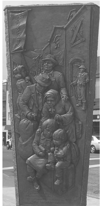
図2 日本町ランドマーク「強制収容」パネル 2008年3月