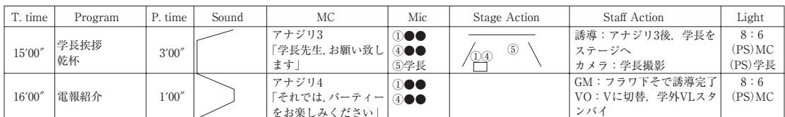
図4 キューシートの一部

残りの4列を説明するには、業務分担と技術用語の解説が必要となる。8列目の「スタッフアクション」列だが、「学長挨拶・乾杯」と「電報紹介」のプログラムでは、「誘導」、「カメラ」、「GM」、「VO」という4つの担当への指示が書かれている。「誘導」というのは、誘導の担当である。ここでは学長が舞台上へと出て行くときに送り出すことになっている。「カメラ」は、カメラ操作係である。カメラで撮影している映像は舞台上のスクリーンに同時に映し出される仕組みになっているが、「学長撮影」して学長を映し出す