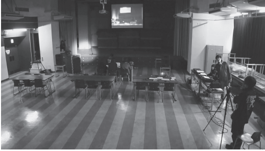
図2 カメラBの画像：無人のマイク前にピンスポット照明があたったところ [40:55.18]