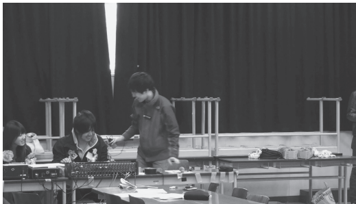
図3 カメラAの画像：右からディレクタ，マイクミキサー，サウンドディレクタ [46:44.09]

ハーサル4日目の記録である。ビデオカメラ2台とICレコーダ1台を使って録画と録音を行った。ビデオカメラの1台(Canon HF G10)はX教室後方の階段部分中程に設置した。舞台とその上のプロジェクタ用スクリーン，教室前方平面フロア部分全体，とくに右側に位置する放送部関係者とディレクタ，舞台のすぐ下正面のタイムキーパーとビデオオペレータという，活動のほぼ全貌を捉える位置である(図2を参照)。純正ワイドコンバージョンレンズ(Canon WD-H58W)を付けて三脚に固定とし，操作者は置かずにずっと撮りっぱなしとした。これをカメラBとする。カメラAは，舞台手前の左手，フロア上に設置した(Sony HDR-SR12)。純正ワイヤレスマイクセット(Sony ECM-HW2)を装着し，マイクをQディレクタにつけてもらった。画面はディレクタ中心とした(図3を参照)。こちら