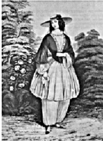
図7 ブルーマー・スタイルの女性 山内沙織訳 PARCO 出版, 1985 年