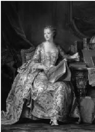
図3 ポンパドゥール夫人の肖像 モーリス・ラ・トゥール画 1755年 ルーヴル美術館所蔵