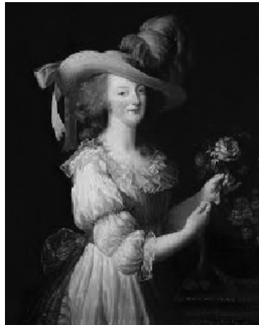
図4 シュミーズに身を包む マリー・アントワネット