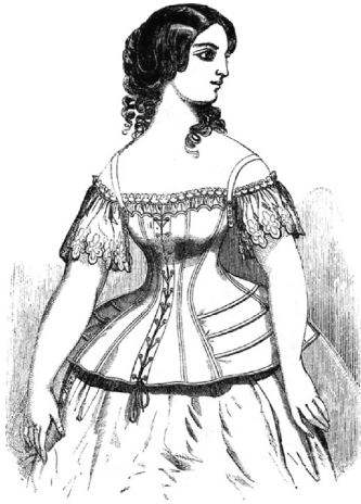
DOUGLAS & SHERWOOD'S CELEBRATED TOURNURE CORSET. (Patented January 4, 1856.)