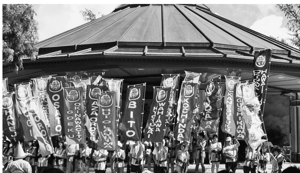
図1 オキナワン・フェスティバルのオープニング 市・町・村人会の旗が並ぶ（2015年9月5日@ホノルル、カピオラニ公園）

S：村人会の役割といえば、オキナワン・フェスティバルでも村人会は重要な役割を果たしますね。フェスティバルにはHUOA傘下の50のローカリティ・クラブ（市・町・村・字人会など）がほとんどすべて参加しますね（図1）。あるクラブはサーターアンダーギー（いわゆる沖縄ドーナッツ）を作り、あるクラブは沖縄そばを作るという具合に。東