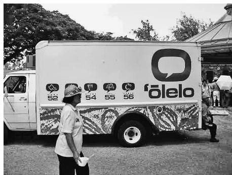
図2 オレロのバン（2000年9月2日 白水撮影@ホノルル、カピオラニ公園）

ビデオ制作で最も骨の折れる作業は編集（editing）である。ハワイ沖縄センターにある映像編集専用の部屋に籠りコンピューターに向かって編集作業を長時間にわたり行うのは心身とも疲れるものである。2009年、チームリーダーの座