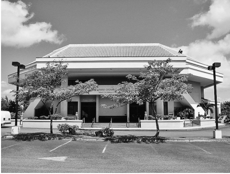
図3 約10億円の巨費を投じた「ハワイ沖縄センター」(2004年白水撮影@オアフ島のワイピオ)

の一人だ。かれらは沖縄文化の永続をはかる(perpetuate) ために、自分の生活を犠牲にして(sacrificing) 働いた。そして、かれらと働くことが私にとって喜びだった。