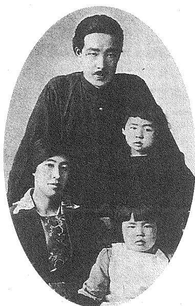
図5 新婦人協会の頃の一家（大正9, 10年ごろ）